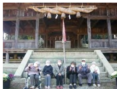
初詣 天満神社へ皆で お参り