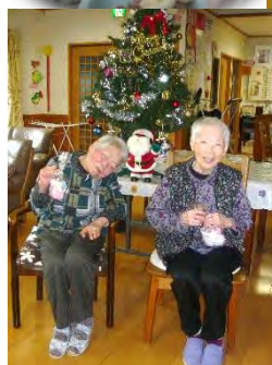
クリスマス会 手作りチョコケーキ をいただきまーす！