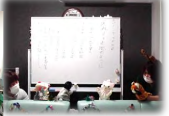
「ジングルベル」の 大合唱