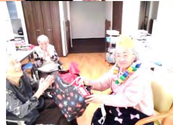
お誕生日おめでとう ございます！