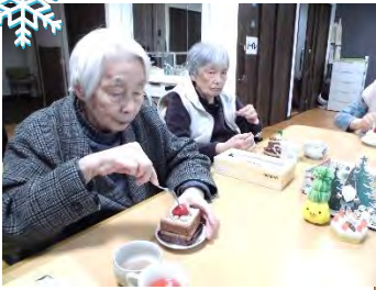
クリスマスケーキ