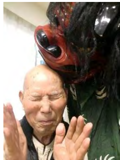
太鼓と獅子 より良い一年にな りますように…